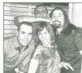
Un groupe Pop/rock qui a su faire sa place.

Après leur premier passage remarqué en Janvier au Sa-